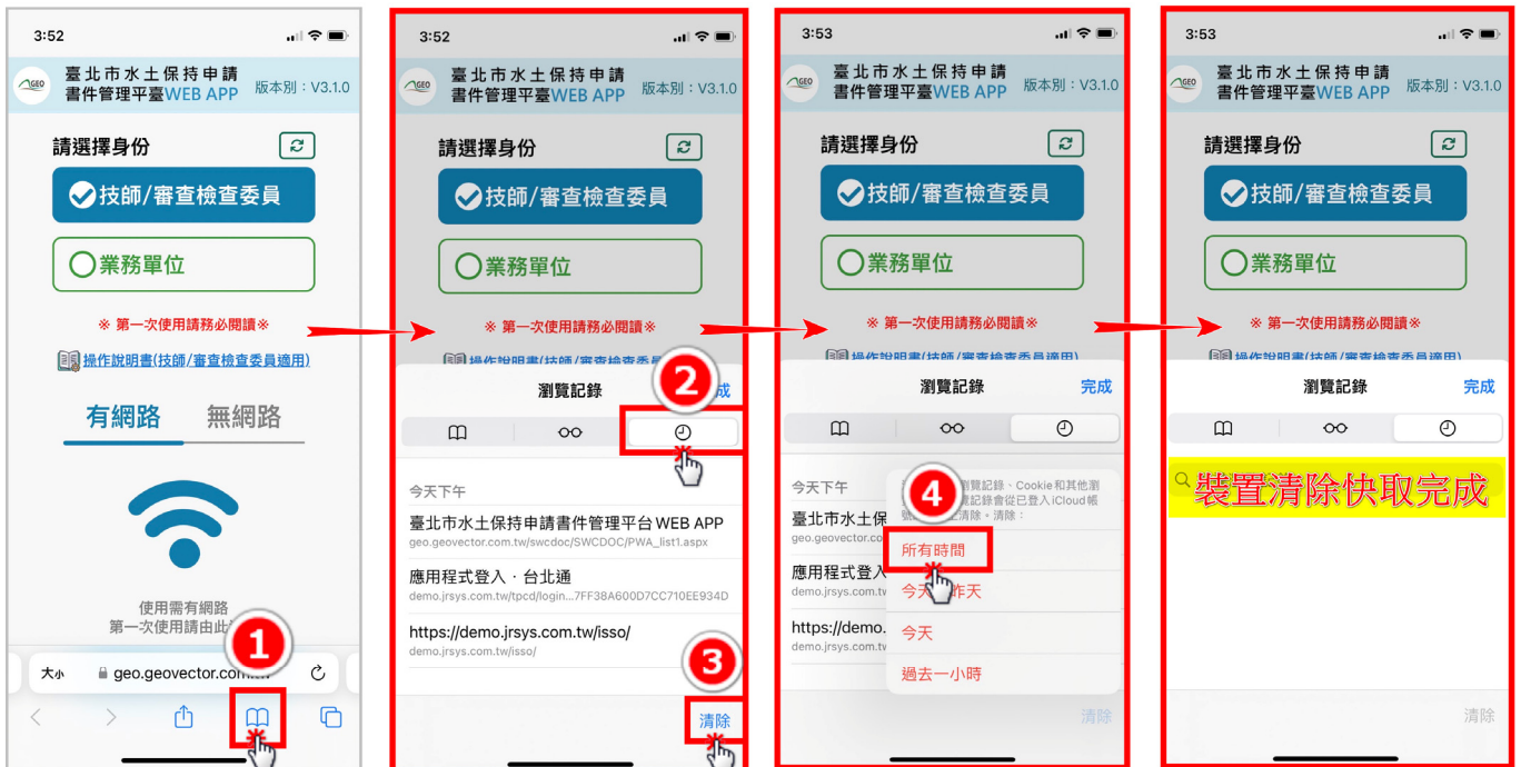
圖 1：清除裝置快取（以 iPhone 手機 Safari 為示範）