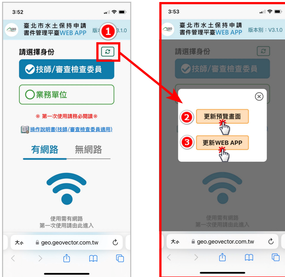
圖 2：「更新預覽畫面」與「更新 WEB APP」於首頁右上方

清除完裝置快取後，請重新進入書件管理平臺 WEB APP，請點選右上方更新圖示，點下後畫面出現「更新預覽畫面」及「更新 WEB APP」兩顆按鈕。