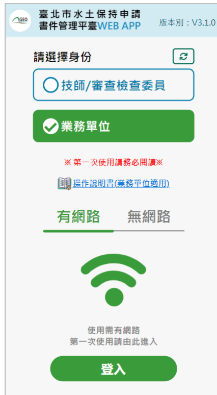
圖 5：行動裝置書件平台首次使用登入畫面

使用行動裝置書件平台首次登入時，須於有網路之環境進行操作，選擇操作身分後點選下方登入按鈕。