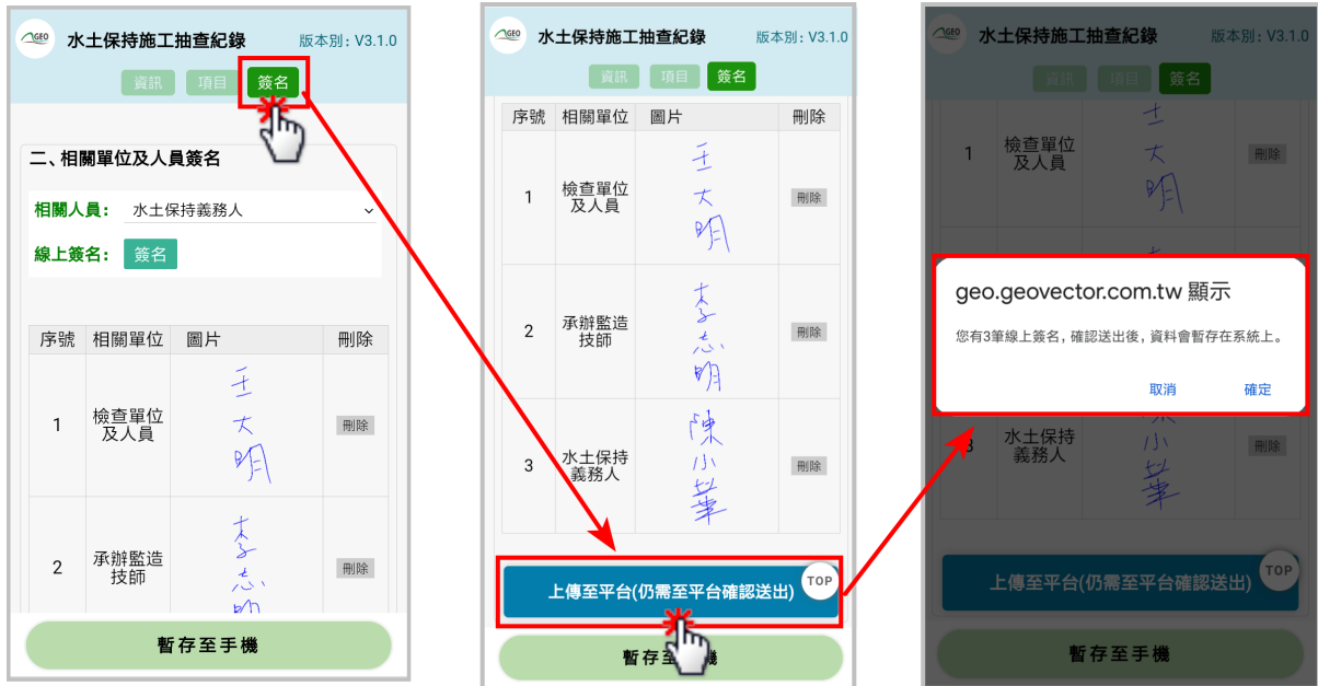
圖 19：檢查表單上傳至平台

若欲將填登完畢之檢查表單上傳至平台，請務必確認您在有網路的環境下操作。表單填寫完畢欲上傳至平台時，點選至各表單最後一個頁籤後，往下至網頁底部點選「上傳至平台(仍需至平台確認送出)」，系統將提醒目前共有幾筆簽名，於確認無誤後，表單即上傳至「臺北市水土保持申請書件管理平台」。