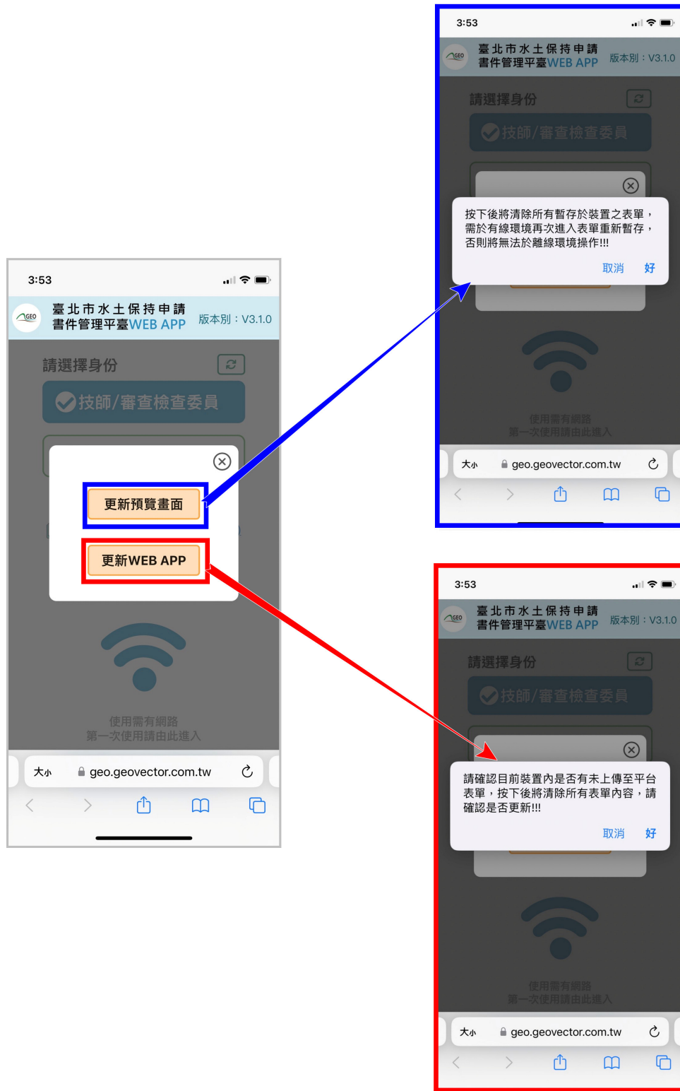
圖 3：點選「更新與覽畫面」與「更新 WEB APP」按鈕

按下按鈕前，請務必確認使用裝置是否有暫存表單或有未送至平臺案件 ，若已確認無未送出資料，請按下「更新預覽畫面」及「更新 WEB APP」兩顆按鈕，即更新成功。